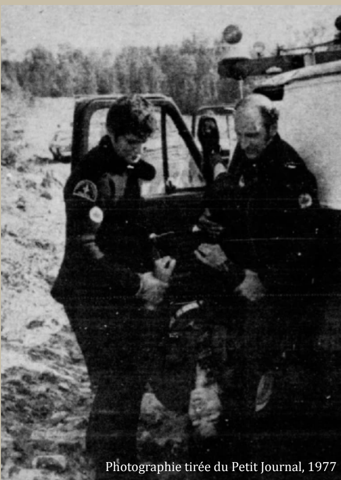
Photographie tirée du Petit Journal, 1977

Encore aujourd'hui, malgré les recommandations d'une enquête nationale, la Commission d'enquête « Viens », le racisme à l'endroit des Premières Nations est toujours présent dans les services publics. Ce racisme a des conséquences tragiques, tel que le décès de l'Atikamekw Joyce Echaquan en 2020. Et, malgré les discours de nos gouvernements, les événements sont nombreux et continuent de s'accumuler.